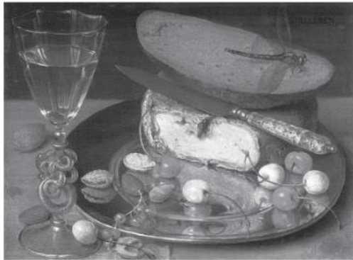
Georg Flegel, „Stilleben mit Kirschen“, 1635, Öl auf Rotbuchenholz

Bei der Anordnung lassen sich verschiedene Gegenstandsgruppierungen feststellen – z.B.: Vereinzelung, Streuung, Gruppierung, Ballung.